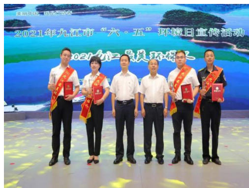
入选九江最美环保人 持续攻坚大气防治第一线