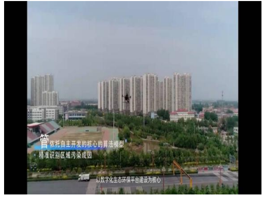
落子淮南东莞 实现市场布局新突破