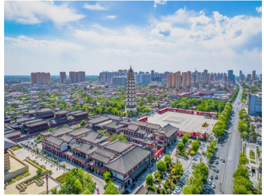
科技守护蓝天，助力定州打好大气攻坚战