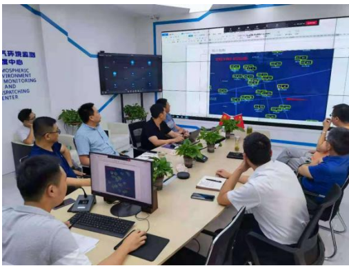
参与重点攻关项目 用实践落实好科学与精准治污