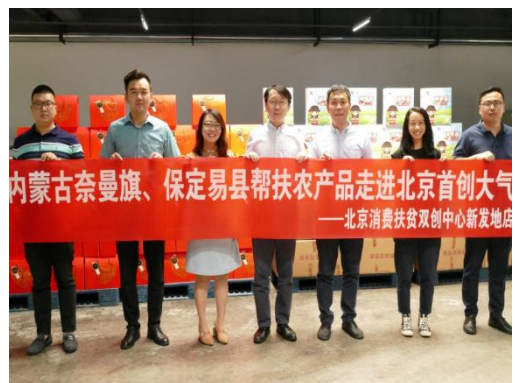
推动消费帮扶，履行社会责任