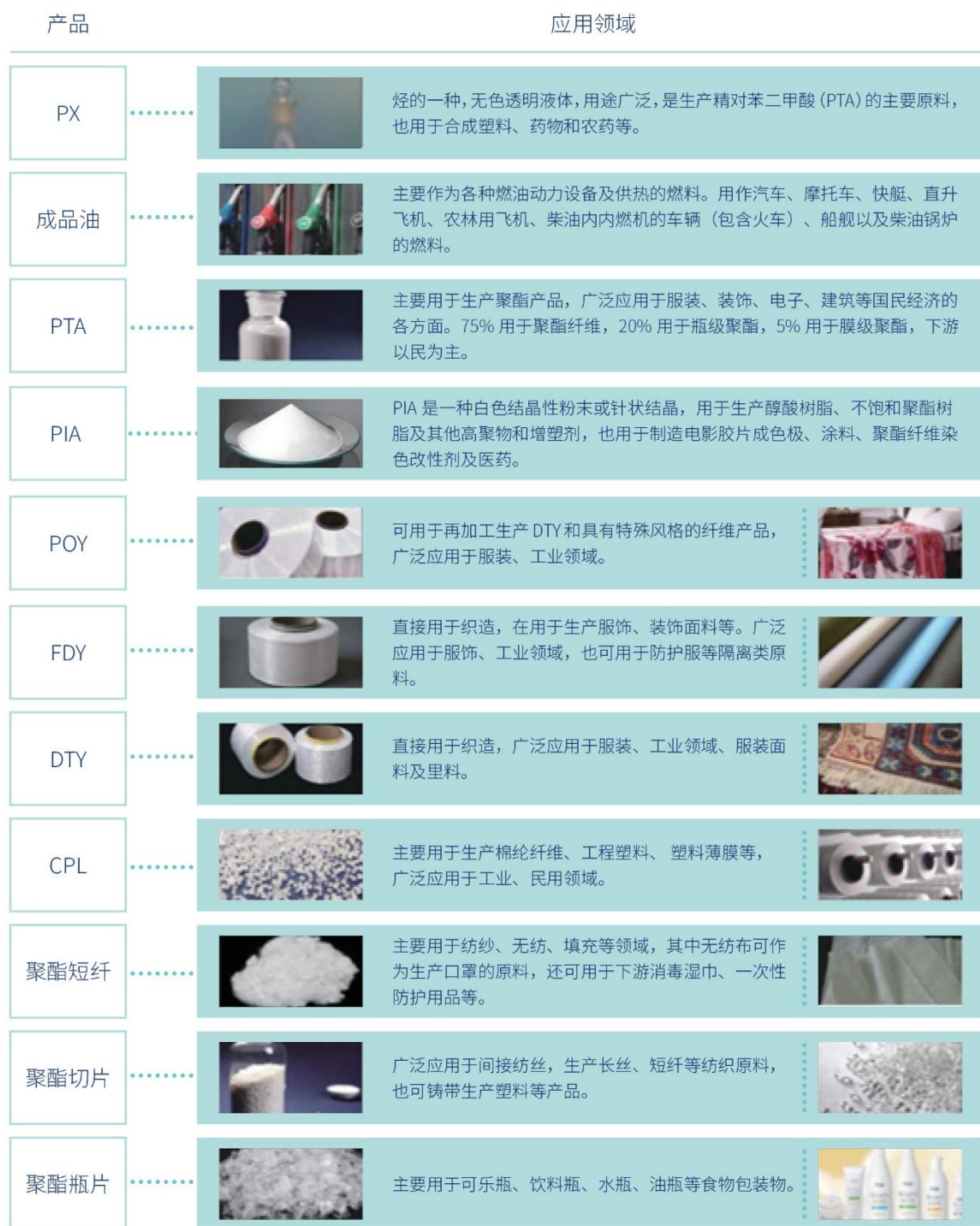
表：公司主要产品特点及应用领域