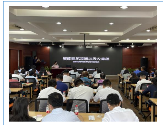
街道组织和社区物业的推广对接会。