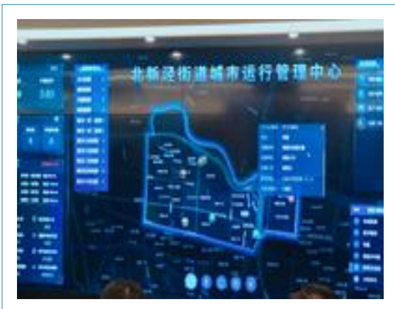
建筑垃圾智能收运系统接入“一网统管”平台。