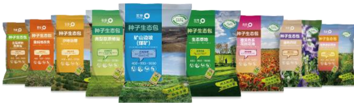
图解：蒙草种子生态包产品包装局部

公司在生态修复机械作业上进行了研发，播种整地的工序上研发了独立补播机、旋耕播种机、手扶坐骑式播种机等，引进了捡石机、无人机、抛肥机、播种机等，开发与引进的机械在项目作业上进行了推广、应用、实施，现场效果良好，节约控制了成本费用。生命共同体产品开发了 10 类共计 276 个单品，已经投产了 212 个单品，生态包产品优化升级试验、新型生态包产品开发试验（调茬包、土壤改良包、抗旱生态包、盐碱地改良包），草种业现有的六大产品体系，435 款产品，已经投产 342 款。应用到草原生态修复、矿山荒废地治理、沿黄流域生态保护等生态修复项目中。