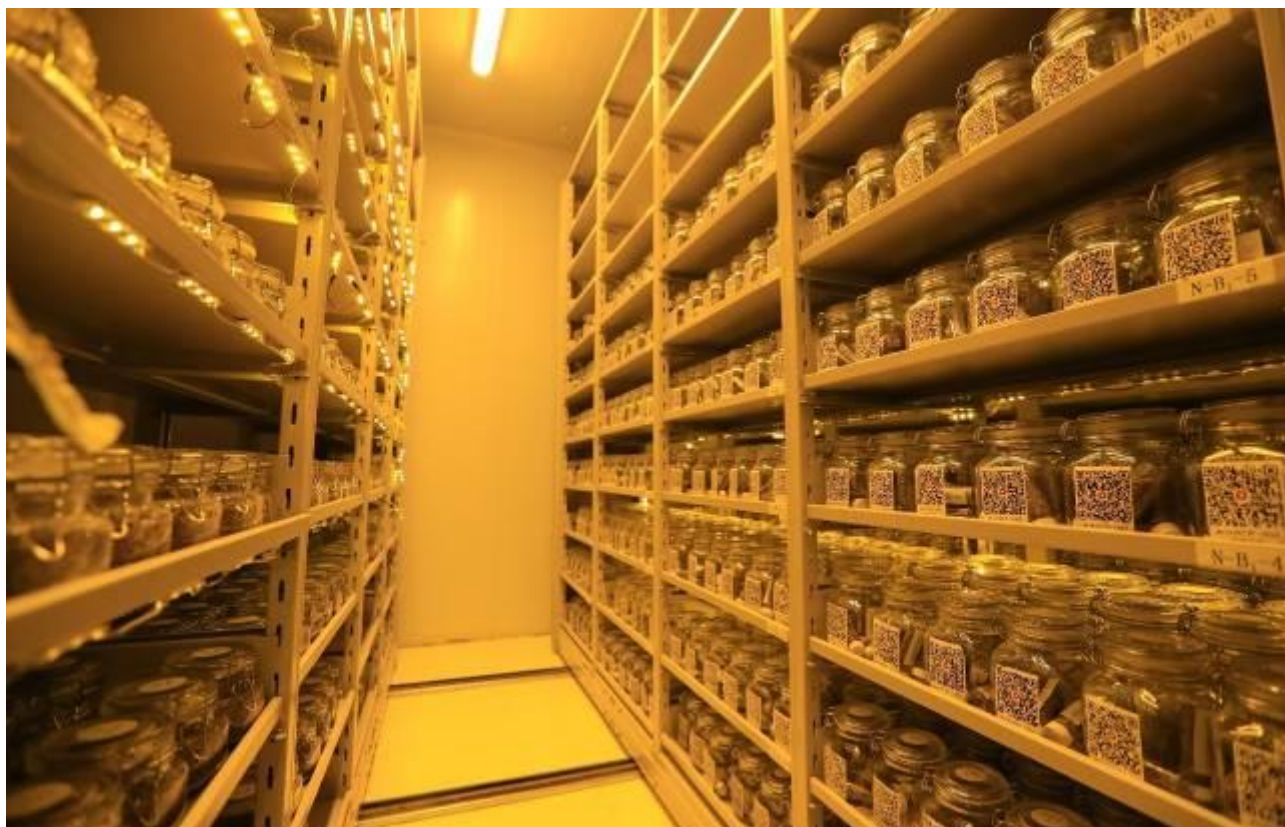
图解：蒙草种质资源库长期库存放的乡土植物原种