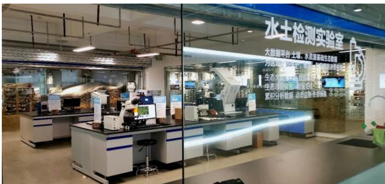
图解：蒙草种子监测实验室

报告期，公司继续实施“百万采样计划”，制定下发了 2021 年采种任务，并在阿拉善、甘肃、青海、大青山等地采集植物标本、土壤、种子。收集、利用北方干旱半干旱地区野生乡土植物、特色农作物及其近缘种及道地药材等种质资源，开展植物种质资源保存、鉴定、评价、选育等工作，继续夯实种质资源数据基础。公司与国际竹藤中心合作选取生态修复、食用牧草领域代表性的腾格里蒙古韭、大青山细叶百合等 6 个草种进行航天搭载试验，开展发芽实验、建立组培无菌体系、播种育苗，各项实验如期开展。结合国际竹藤中心航天育种的科研优势，拓展航天技术在乡土植物种质资源“育繁推”中的实践应用。