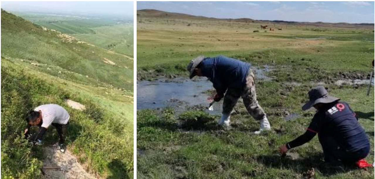
图解：蒙草员工在西藏、新疆采集种质资源

公司将继续以种质资源收集鉴定保存评价、优良新品种培育、良种扩繁及推广应用为技术创新重点，突破种质资源创新、丰产栽培、种子加工和质量控制等关键技术，扩大优质种质规模化生产，推动草种质资源优势尽快转化为产业优势，解决生态、生产对优质草种的需求。