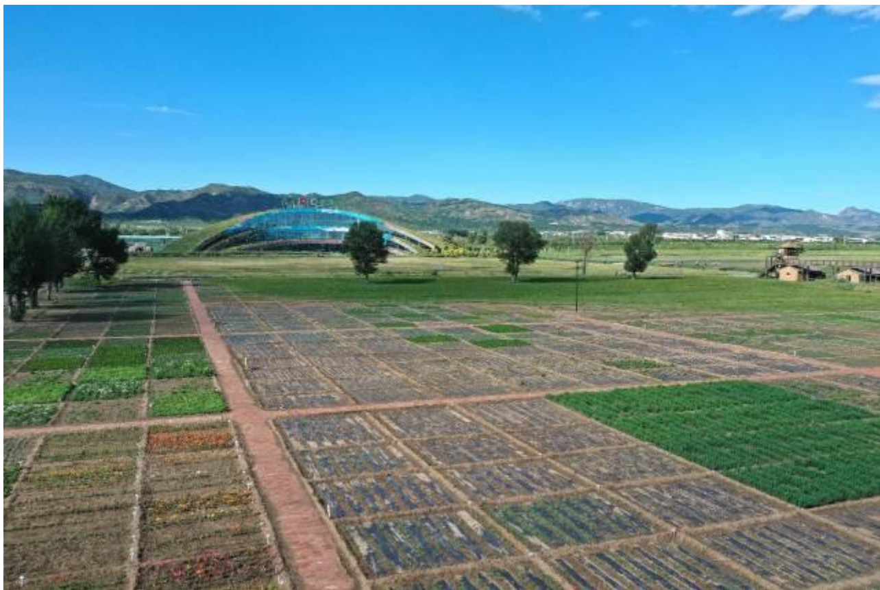
图解：呼和浩特敕勒川生态谷的种质资源圃局部

公司在生态修复机械作业上进行了研发，播种整地的工序上研发了独立补播机、旋耕播种机、手扶坐骑式播种机等，引进了捡石机、无人机、抛肥机、播种机等，开发与引进的机械在项目作业上进行了推广、应用、实施，现场效果良好，节约控制了成本费用。生命共同体产品开发了 10 类共计 276 个单品，已经投产了 212 个单品，生态包产品优化升级试验、新型生态包产品开发试验（调茬包、土壤改良包、抗旱生态包、盐碱地改良包），草种业现有的六大产品体系，435 款产品，已经投产 342 款。应用到草原生态修复、矿山荒废地治理、沿黄流域生态保护等生态修复项目中。