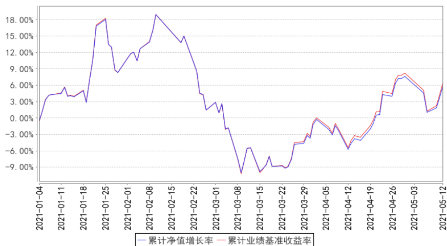
华宝中证医疗指数累计净值增长率与同期业绩比较基准收益率的历史走势对比图

注：本基金转型日期为 2021 年 1 月 1 日，截止至本报告期末，本基金转型未满一年。