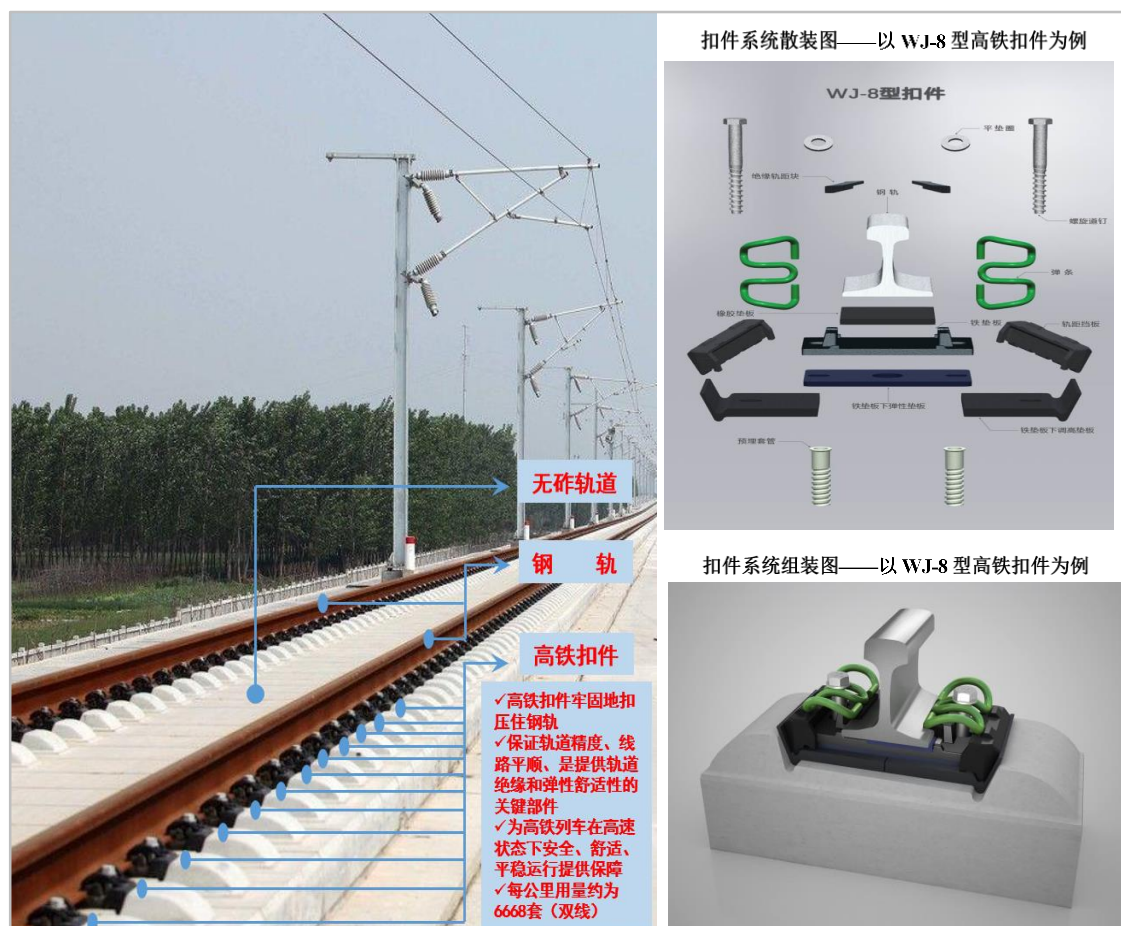
轨道扣件应用场景示意图

经过十余年的发展，公司形成了以高铁扣件为核心，同时包括预应力钢丝及锚固板、铁路桥梁支座、工程材料以及轨道部件加工服务在内的高铁工务工程产品体系，公司产品已覆盖至轨道、桥梁和隧道等高铁工务工程领域。