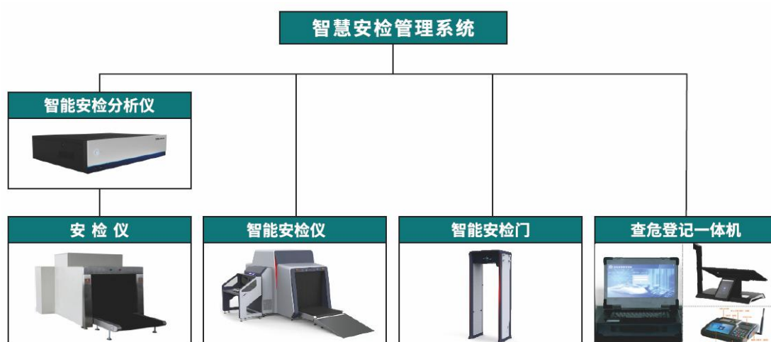
图2：智慧安检管理系统

智慧安检管理系统基于深度学习算法，支持枪支及主要零部件、刀具、瓶装液体、喷罐、剪刀、电池、电脑、手机、烟花爆竹等15大类41小类违禁品的智能识别，识别率90%以上。同时，系统实现了设备联网、数据联网、场景融合、业务融合，打破以往的数据孤岛，充分利用物联网的便捷、高效，大数据的预警与趋势分析，有效提高了安检工作的效率和质量。