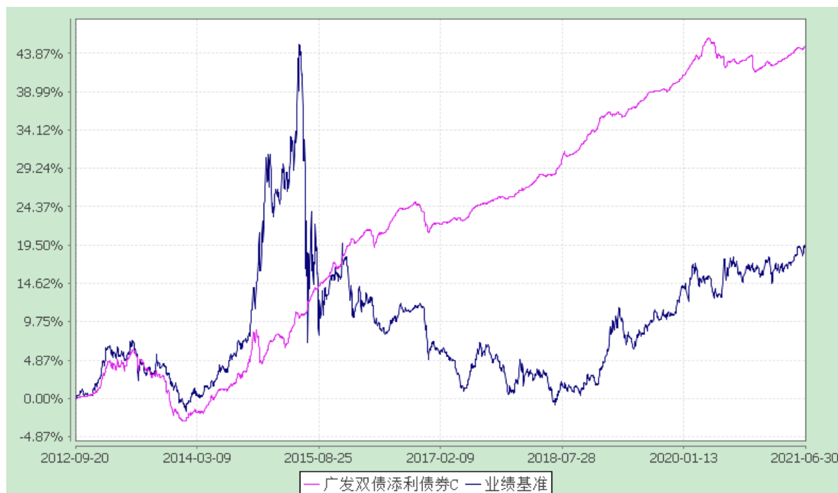
广发双债添利债券 E