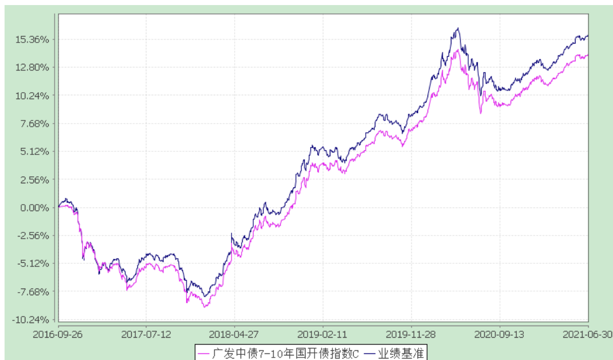
广发中债 7-10 年期国开债指数 E