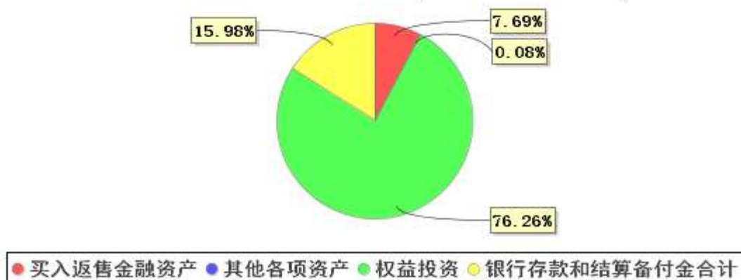
投资组合资产配置图表(2021年6月30日)