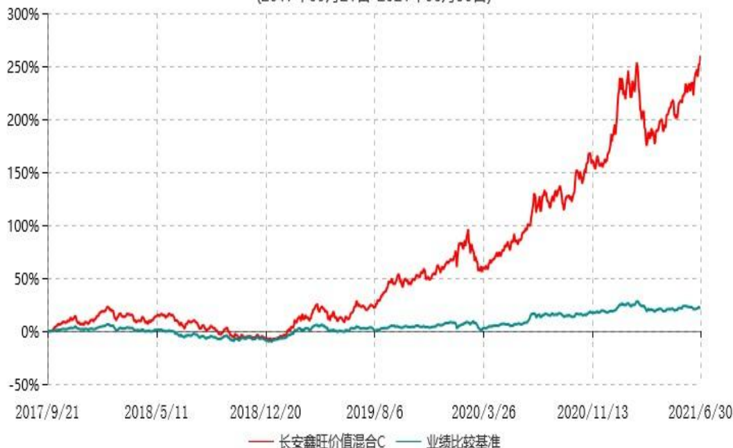
长安鑫旺价值混合C累计净值增长率与业绩比较基准收益率历史走势对比图 (2017年09月21日-2021年06月30日)

根据基金合同的规定,自基金合同生效之日起6个月内基金各项资产配置比例需符合基金合同要求。本基金在建仓期结束后,各项资产配置比例已符合基金合同有关投资比例的约定。基金合同生效日至报告期末,本基金运作时间已满一年。图示日期为2017年9月21日至2021年6月30日。