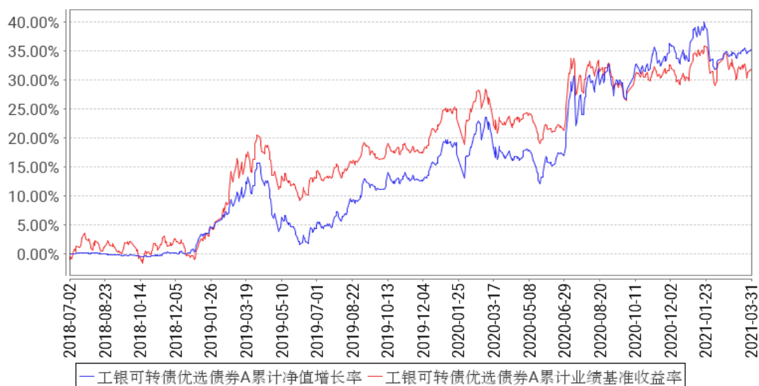
工银可转债优选债券A累计净值增长率与同期业绩比较基准收益率的历史走势对比图