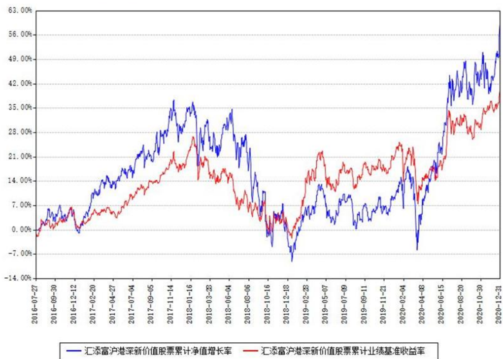
汇添富沪港深新价值股票累计净值增长率与同期业绩基准收益率对比图