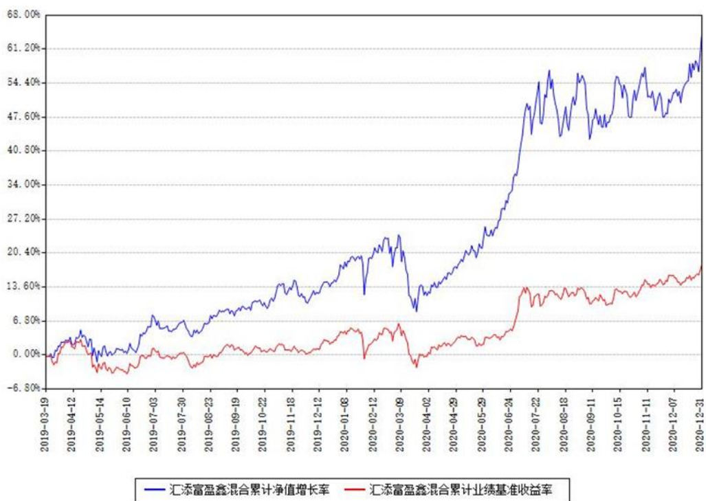
汇添富盈鑫混合累计净值增长率与同期业绩基准收益率对比图