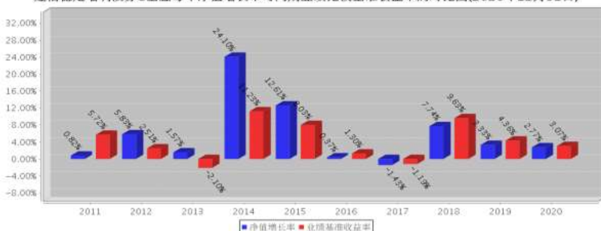
建信稳定增利债券C基金每年净值增长率与同期业绩比较基准收益率的对比图(2020年12月31日)