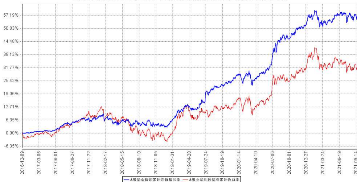
A级基金份额累计净值增长率与同期业绩比较基准收益率的历史走势对比图