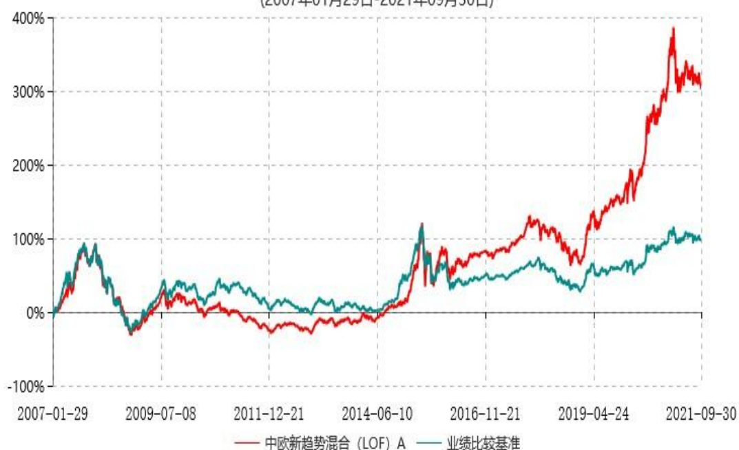
中欧新趋势混合（LOF）A累计净值增长率与业绩比较基准收益率历史走势对比图 (2007年01月29日-2021年09月30日)