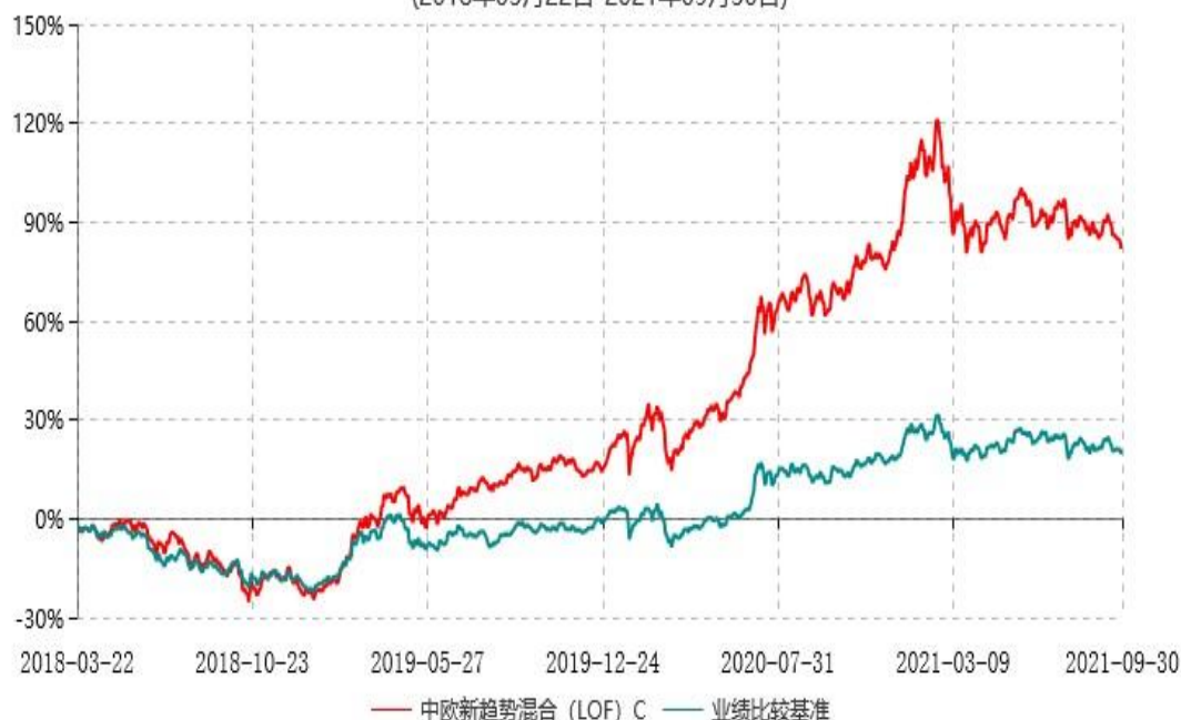
中欧新趋势混合（LOF）C 累计净值增长率与业绩比较基准收益率历史走势对比图 (2018年03月22日-2021年09月30日)

注：本基金于 2018 年 3 月 21 日新增 C 类份额，图示日期为 2018 年 3 月 22 日至 2021 年 09 月 30 日。