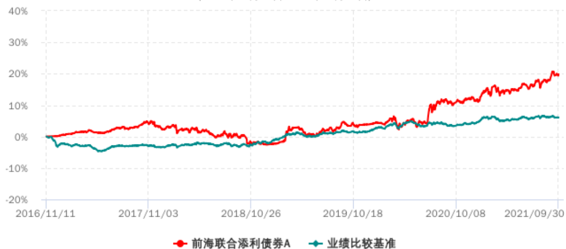
前海联合添利债券A累计净值增长率与业绩比较基准收益率历史走势对比图 (2016年11月11日-2021年09月30日)