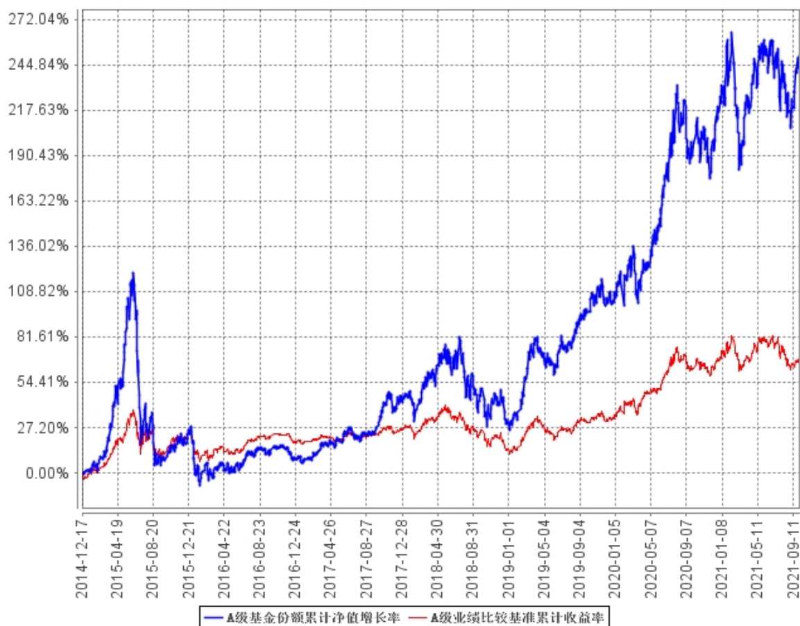
A级基金份额累计净值增长率与同期业绩比较基准收益率的历史走势对比图