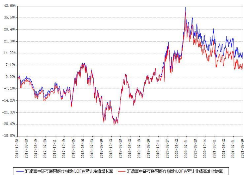
汇添富中证互联网医疗指数(LOF)A累计净值增长率与同期业绩比较基准收益率对比图