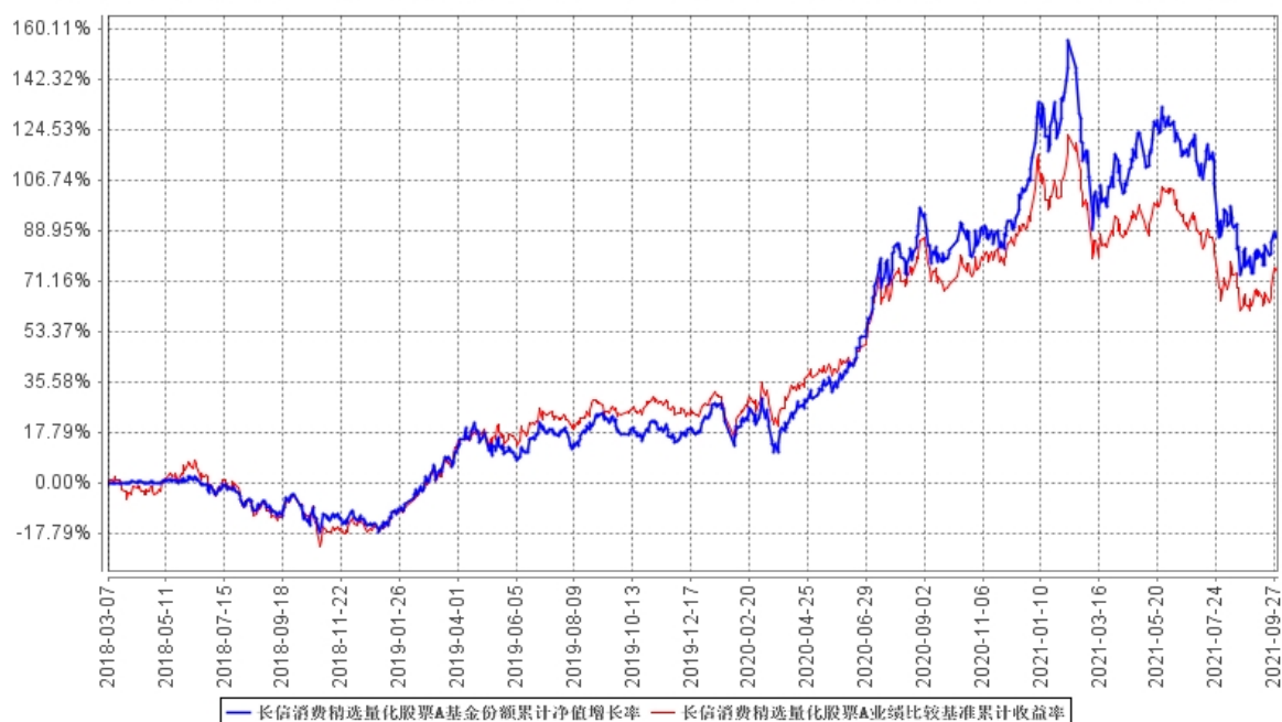
长信消费精选量化股票A基金份额累计净值增长率与同期业绩比较基准收益率的历史走势对比图