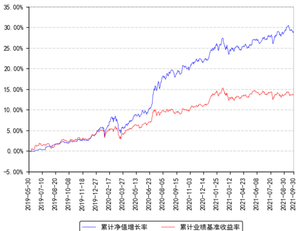
南方致远混合A累计净值增长率与同期业绩比较基准收益率的历史走势对比图