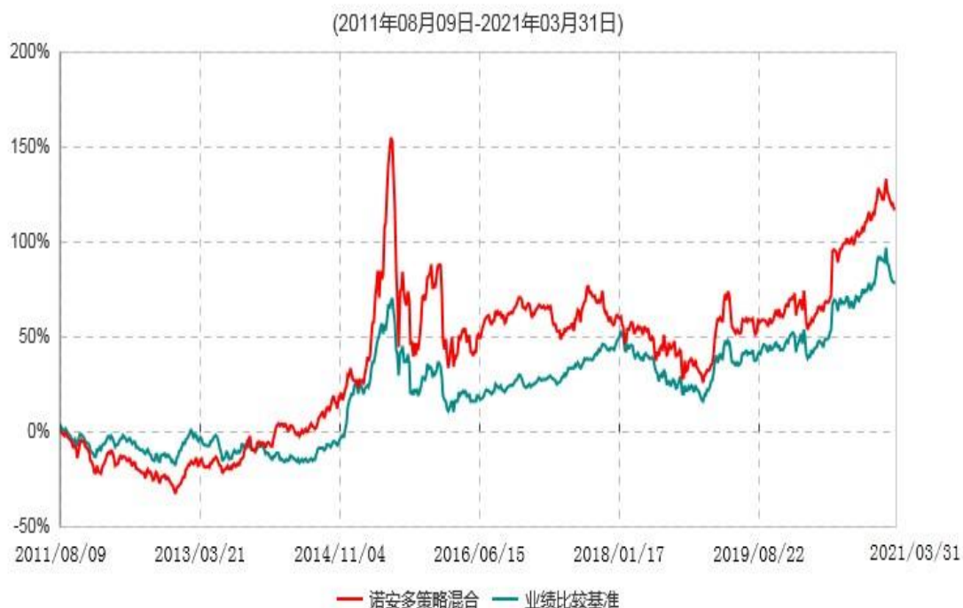
诺安多策略混合型证券投资基金累计净值增长率与业绩比较基准收益率历史走势对比图

二、自基金合同生效以来基金份额累计净值增长率变动及其与同期业绩比较基准收益率变动的比较