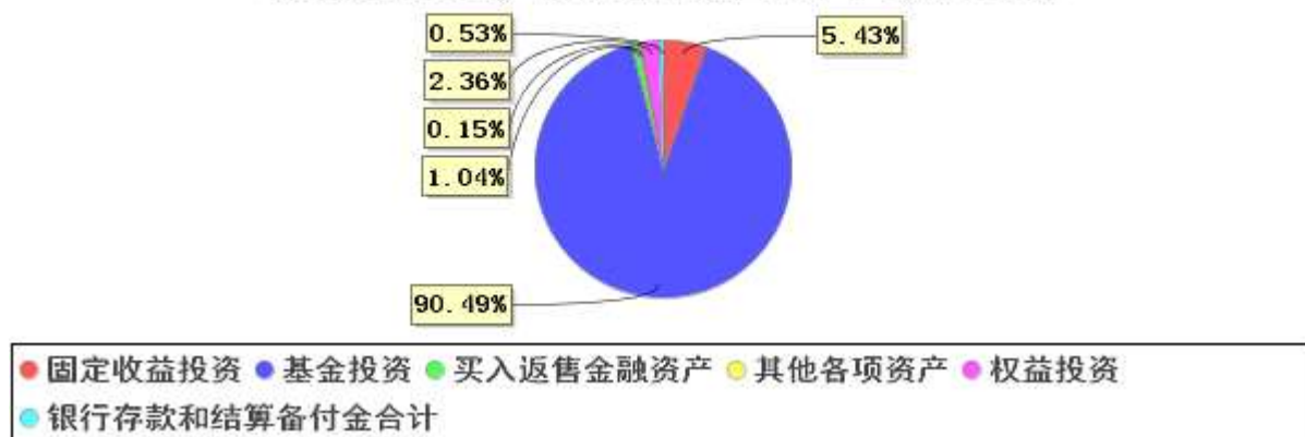
投资组合资产配置图表(2021年9月30日)