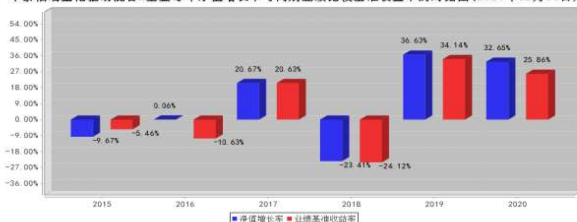
华泰柏瑞量化驱动混合A基金每年净值增长率与同期业绩比较基准收益率的对比图(2020年12月31日)

注:业绩表现截止日期 2020 年 12 月 31 日。基金过往业绩不代表未来表现。