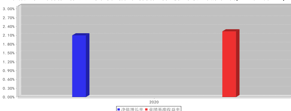
大成汇享一年持有混合A基金每年净值增长率与同期业绩比较基准收益率的对比图(2020年12月31日)

注:1、基金的过往业绩不代表未来表现。 2、如合同生效当年不满完整自然年度的,按实际期限计算净值增长率。