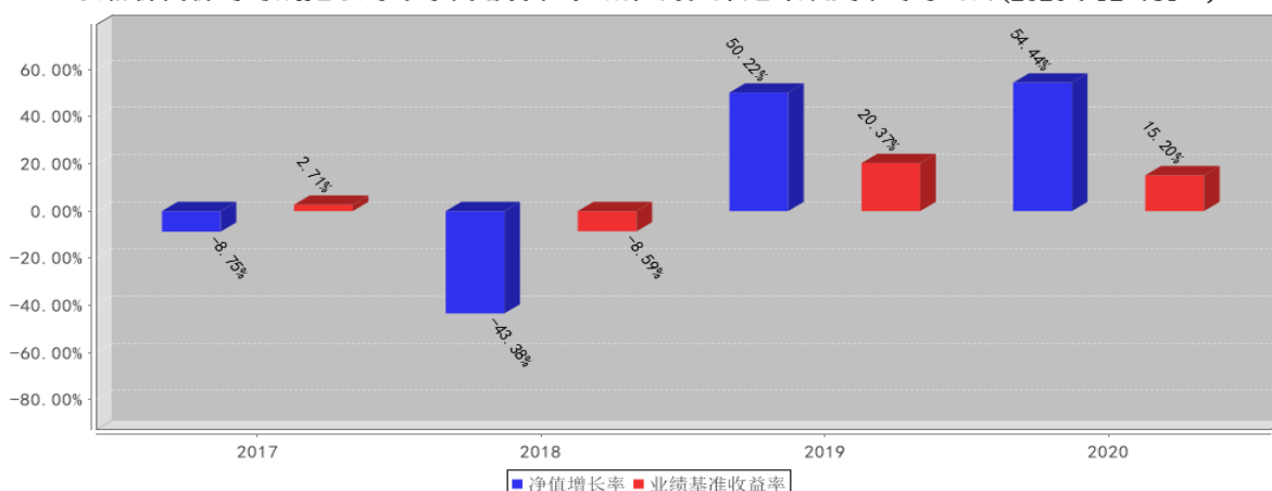
金信价值精选混合A基金每年净值增长率与同期业绩比较基准收益率的对比图(2020年12月31日)