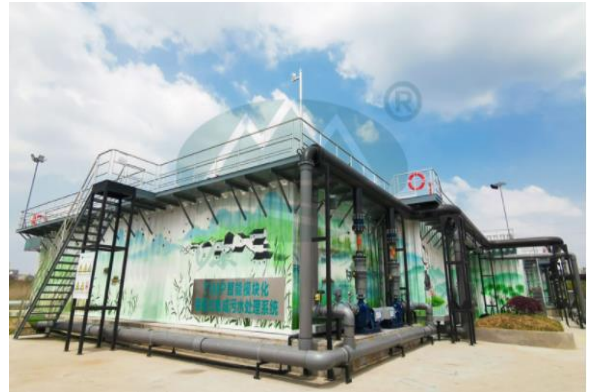
宜兴 1.5 万 t/d 应急污水进入商运