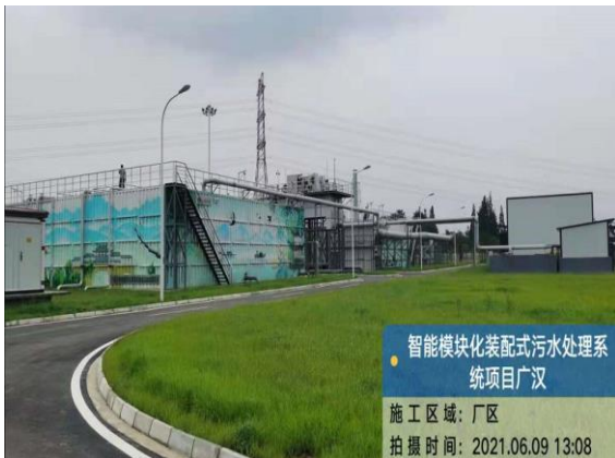
四川广汉 1.5 万吨/天智能模块化集成污水处理系统建设完工