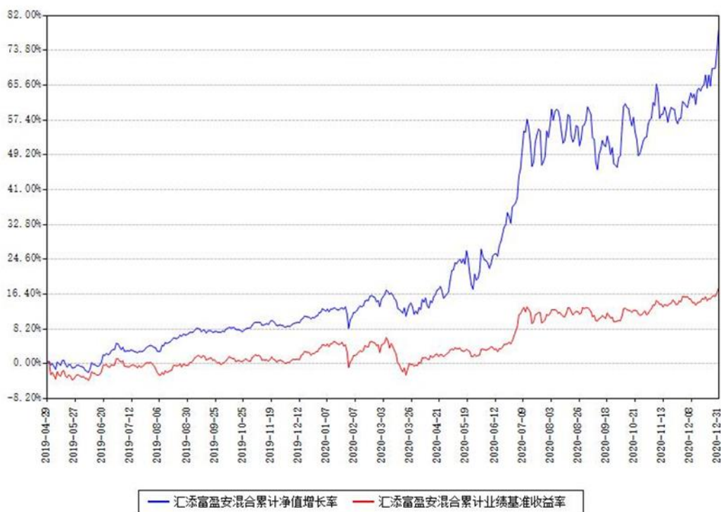
汇添富盈安混合累计净值增长率与同期业绩基准收益率对比图

(二) 自基金合同生效以来基金累计净值增长率变动及其与同期业绩比较基准收益率变动的比较图