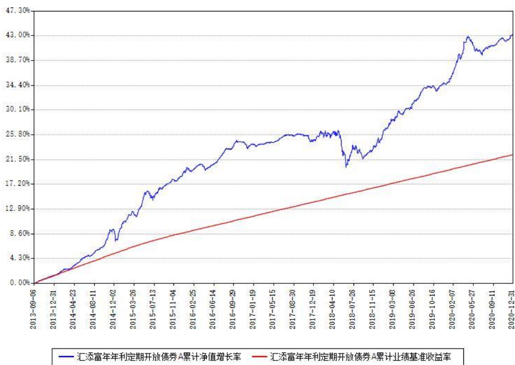
汇添富年年利定期开放债券A累计净值增长率与同期业绩基准收益率对比图