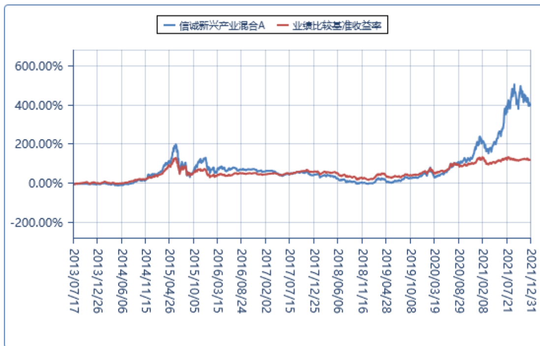
信诚新兴产业混合 C