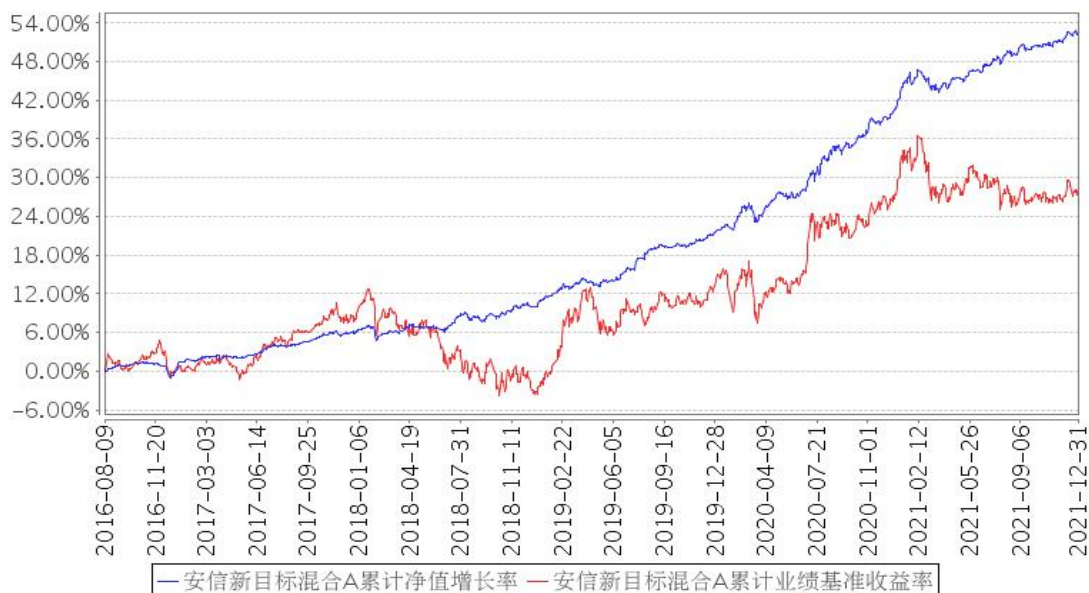
安信新目标混合A累计净值增长率与同期业绩比较基准收益率的历史走势对比图