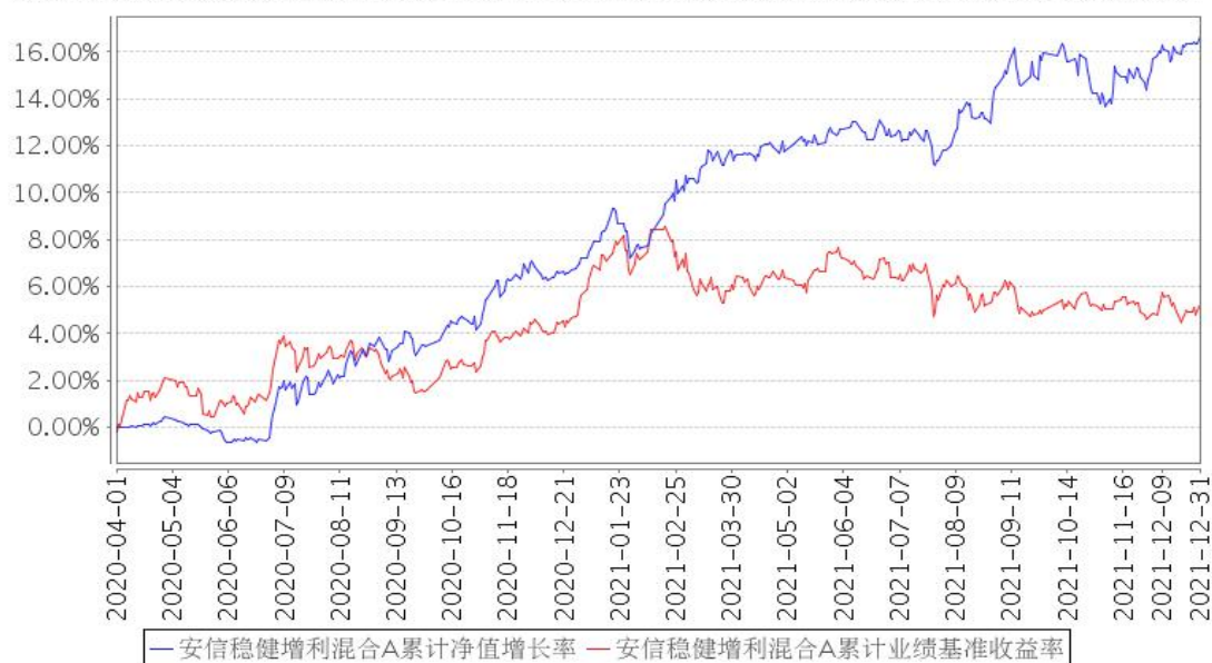
安信稳健增利混合A累计净值增长率与同期业绩比较基准收益率的历史走势对比图