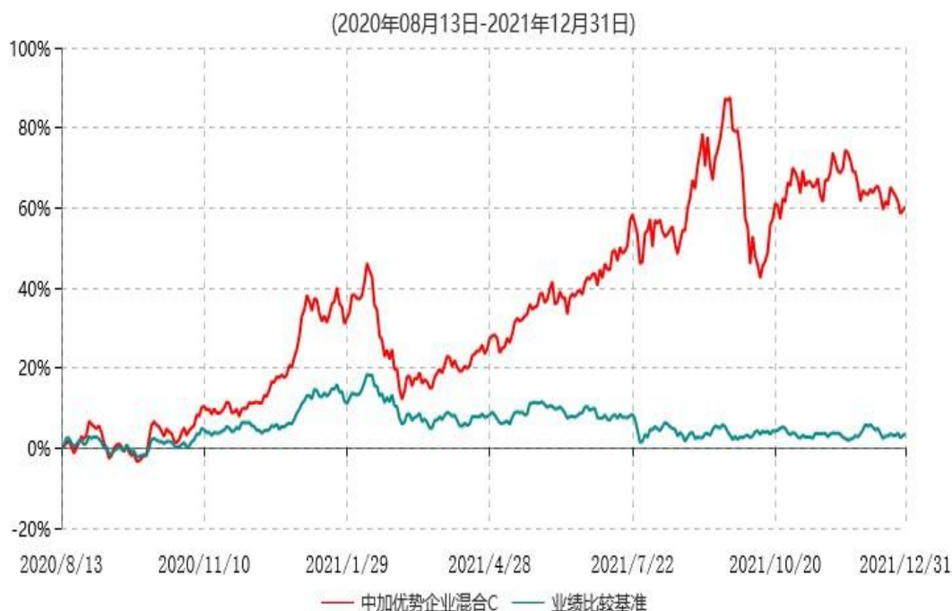
中加优势企业混合C累计净值增长率与业绩比较基准收益率历史走势对比图

注：1. 本基金基金合同于 2020 年 8 月 13 日生效，截至本报告期末，本基金基金合同生效已满一年。