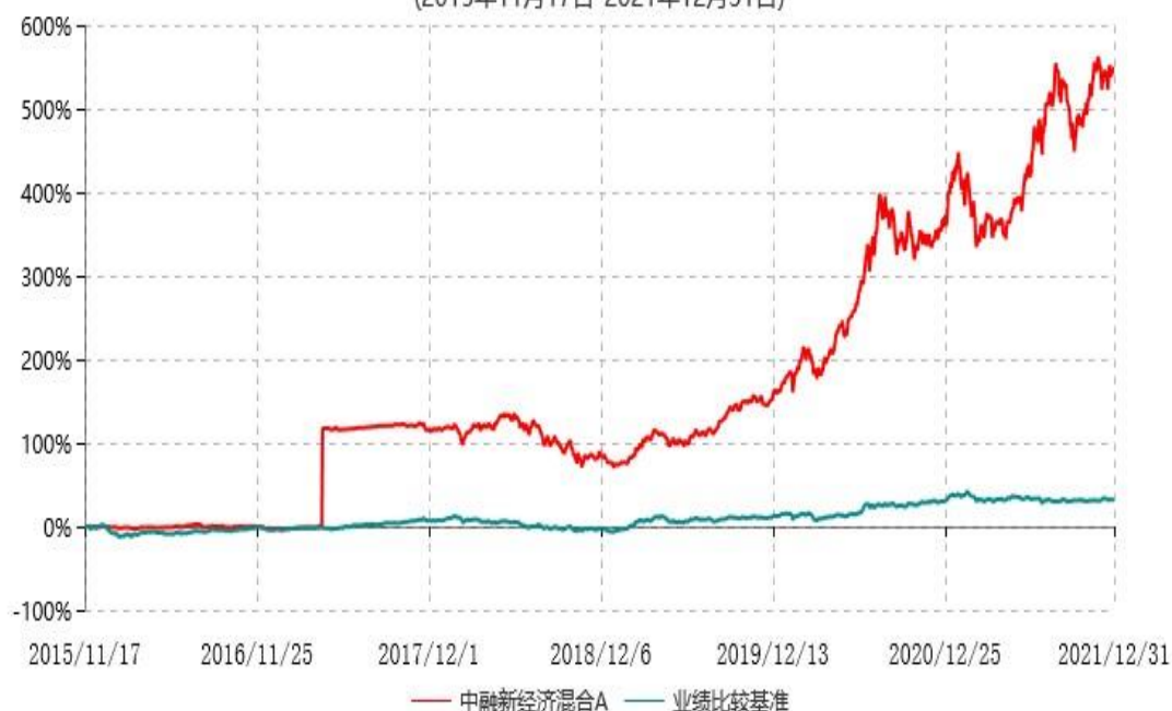
中融新经济混合C累计净值增长率与业绩比较基准收益率历史走势对比图