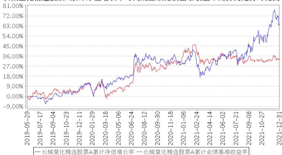
长城量化精选股票A累计净值增长率与同期业绩比较基准收益率的历史走势对比图