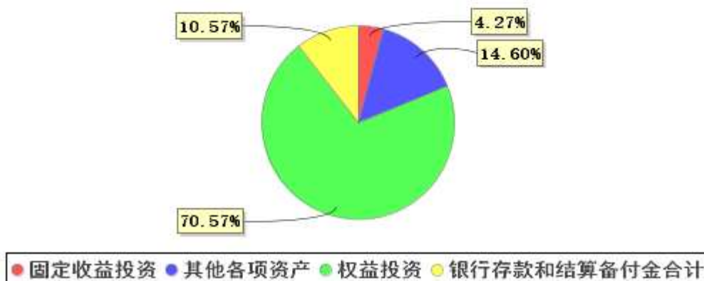
投资组合资产配置图表(2021年6月30日)