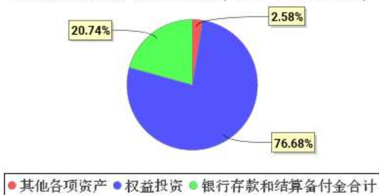
投资组合资产配置图表(2021年3月31日)