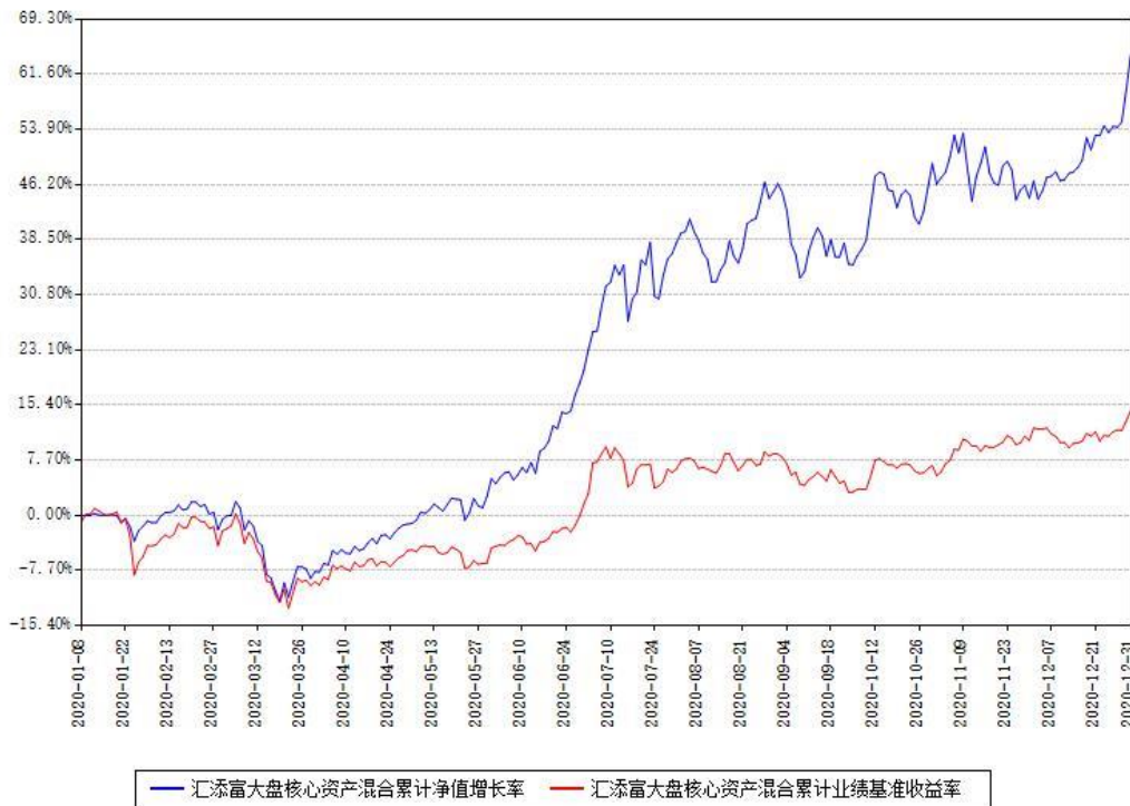
汇添富大盘核心资产混合累计净值增长率与同期业绩基准收益率对比图

(二) 自基金合同生效以来基金累计净值增长率变动及其与同期业绩比较基准收益率变动的比较图