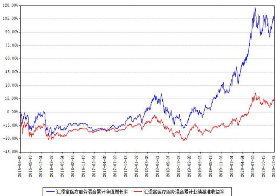
汇添富医疗服务混合累计净值增长率与同期业绩基准收益率对比图