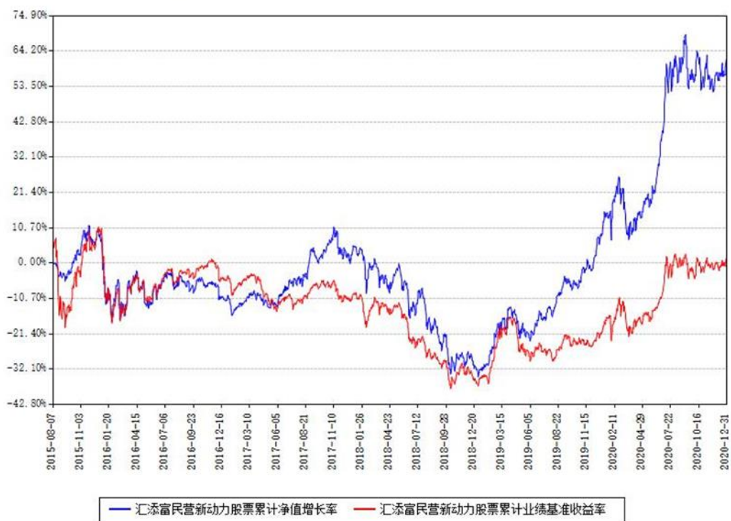
汇添富民营新动力股票累计净值增长率与同期业绩基准收益率对比图