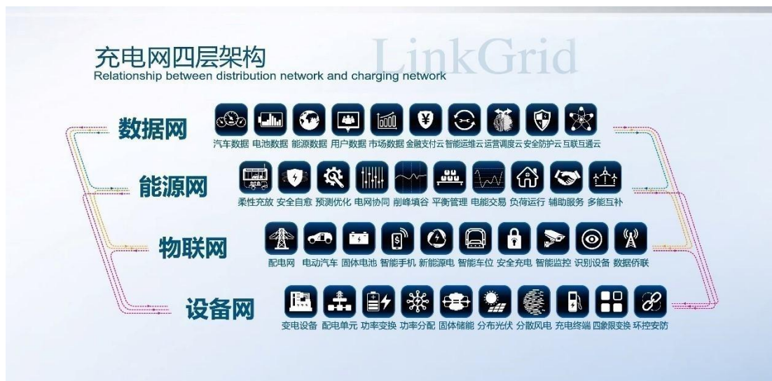
图1：四层网络架构的云台技术体系

公司创新性地搭建了四层网络架构的充电网技术体系，是由功率可灵活调节的充电设备、智能调度控制系统及大数据和云计算平台组成的有机系统，从变电、配电到充放电实现统一调度，通过数据信息与调度控制打通设备层、智能监控层、能源管理层以及大数据分析应用层，在提高充电安全的同时，实现充电设备、汽车、用户、能源的高效协同。