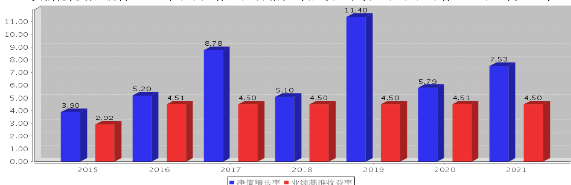
安信稳健增值混合A基金每年净值增长率与同期业绩比较基准收益率的对比图(2021年12月31日)

注:基金合同生效当年期间的相关数据按实际存续期计算。基金的过往业绩并不代表其未来表现。