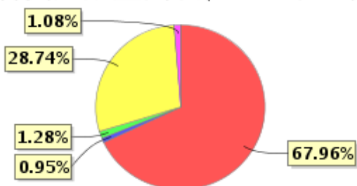
投资组合资产配置图表(2021年12月31日)

● 固定收益投资 ● 买入返售金融资产 ● 其他各项资产 ● 权益投资 ● 银行存款和结算备付金合计