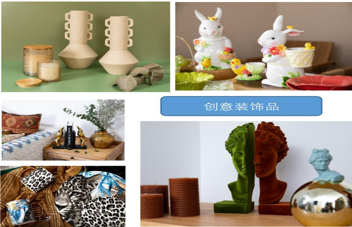
（图1：公司设计的创意装饰品产品图片）

1、创意装饰品： 对于家居创意饰品，公司在研发设计理念上突显创意特性，通过文化创意和设计服务将中华传统文化或外国经典元素融入陶瓷、树脂、竹木、铁件等载体之中，并运用现代的工艺技术制造而成。公司的创意装饰品，按照用途可以划分为节庆装饰品、家居装饰品、日用装饰品及花园装饰品等；按照材质可以划分为陶瓷装饰品、树脂装饰品、纺织装饰品等。公司部分创意装饰产品如下图所示：