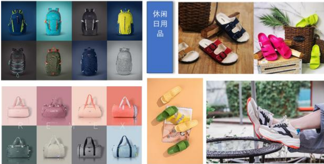
(图2: 公司设计的休闲日用品产品图片)

3、时尚小家具: 对于时尚小家具, 公司在研发设计理念上突显时尚特性, 除具备家具产品·身的实用功能外, 在外观设计上还融合了设计师的创新和灵感, 融入时尚、品质、文化及个性化元素, 满足消费者对生活环境和生活品质的高层次要求。公司的时尚小家具包括装饰小家具、客厅小家具、浴室小家具、收纳小家具等系列。公司部分时尚小家具产品如下图所示: