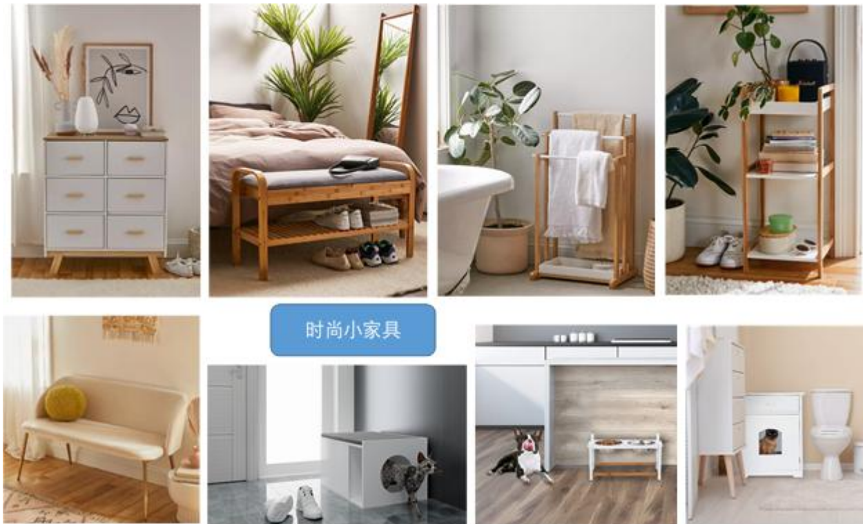
(图3: 公司设计的时尚小家具产品图片)

3、时尚小家具: 对于时尚小家具, 公司在研发设计理念上突显时尚特性, 除具备家具产品·身的实用功能外, 在外观设计上还融合了设计师的创新和灵感, 融入时尚、品质、文化及个性化元素, 满足消费者对生活环境和生活品质的高层次要求。公司的时尚小家具包括装饰小家具、客厅小家具、浴室小家具、收纳小家具等系列。公司部分时尚小家具产品如下图所示: