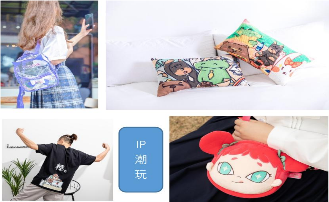
(图4: 公司IP潮玩产品图片)