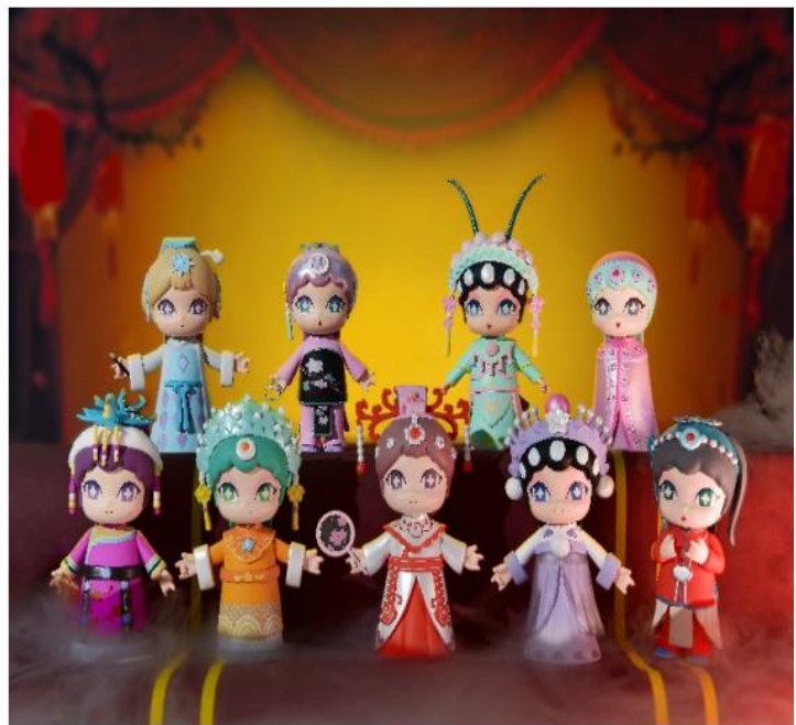
IP 潮玩——盲盒系列、香薰蜡烛