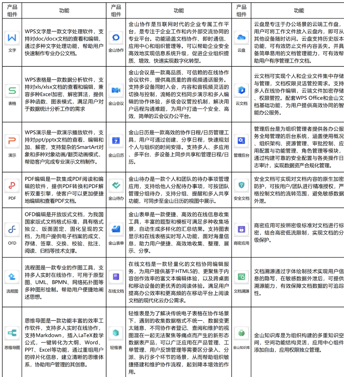
金山办公能力产品矩阵主要组件

上述两款产品涵盖的主要应用功能构建了金山办公能力产品矩阵，其主要产品及功能情况详见下图。