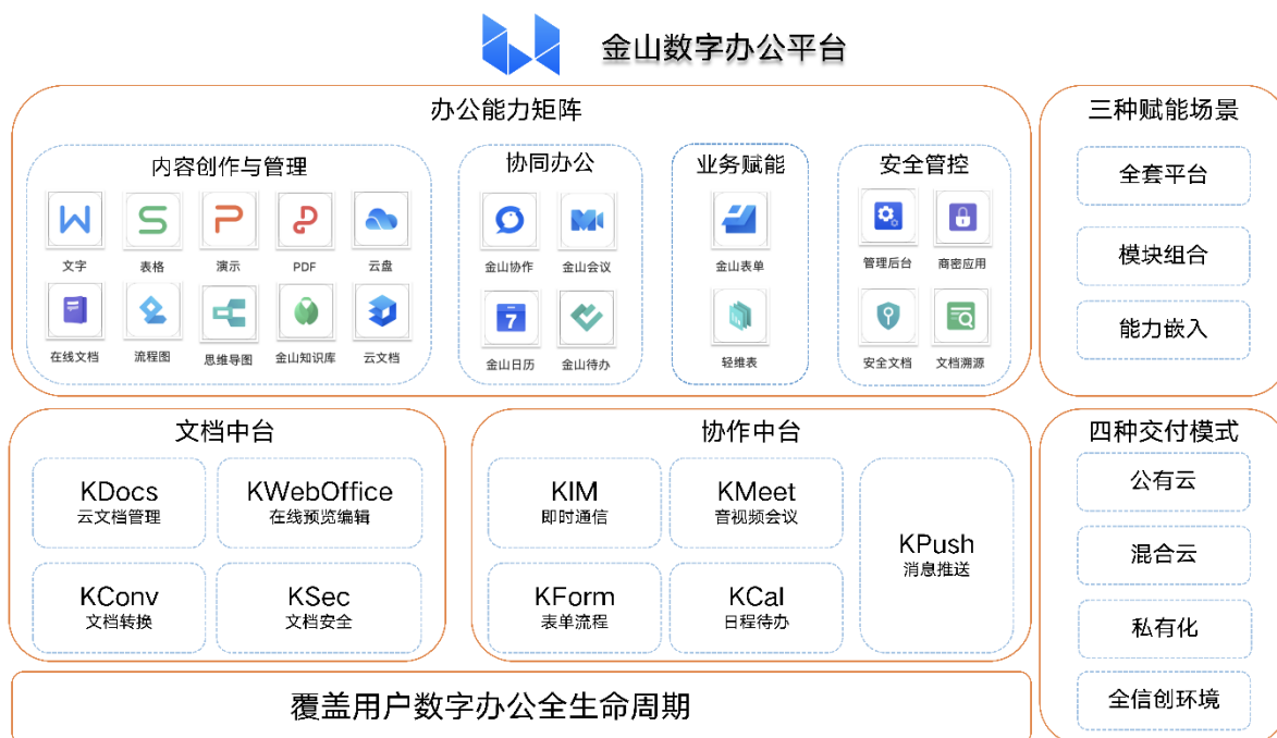
金山数字办公平台全景图

协作两大数字办公中台以及开放的生态体系为用户赋能。面对用户需求场景提供全套平台、模块组合、能力嵌入三种赋能方案，打造了基于公有云、混合云、私有化及全信创环境的四种交付方式。