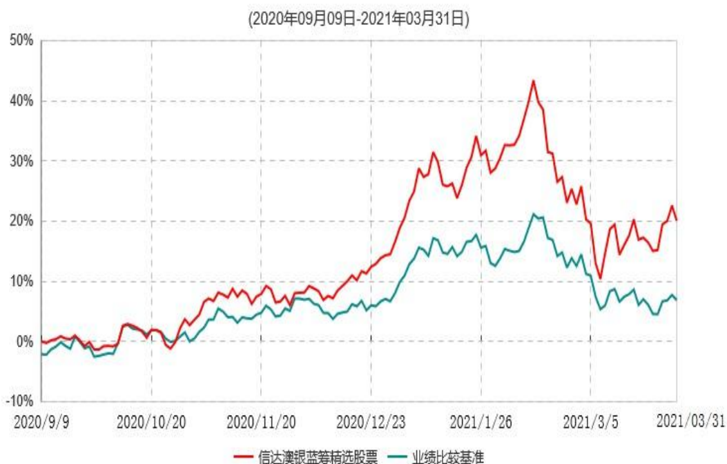
信达澳银蓝筹精选股票型证券投资基金累计净值增长率与业绩比较基准收益率历史走势对比图

注：1、本基金基金合同于2020年9月9日生效，2020年10月28日开始办理申购、赎回、转换、定期定额投资业务。