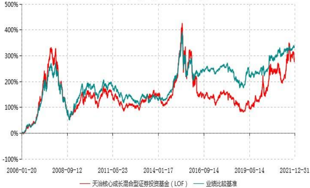
天治核心成长混合型证券投资基金（LOF）累计净值增长率与业绩比较基准收益率历史走势对比图 (2006年01月20日-2021年12月31日)