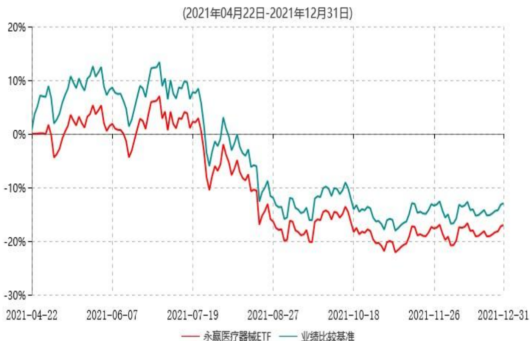
永赢中证全指医疗器械交易型开放式指数证券投资基金累计净值增长率与业绩比较基准收益率历史走势对比图

注：1、本基金合同生效日为2021年4月22日，截至本报告期末本基金合同生效未满1年； 2、本基金在六个月建仓期结束时，各项资产配置比例符合合同约定。