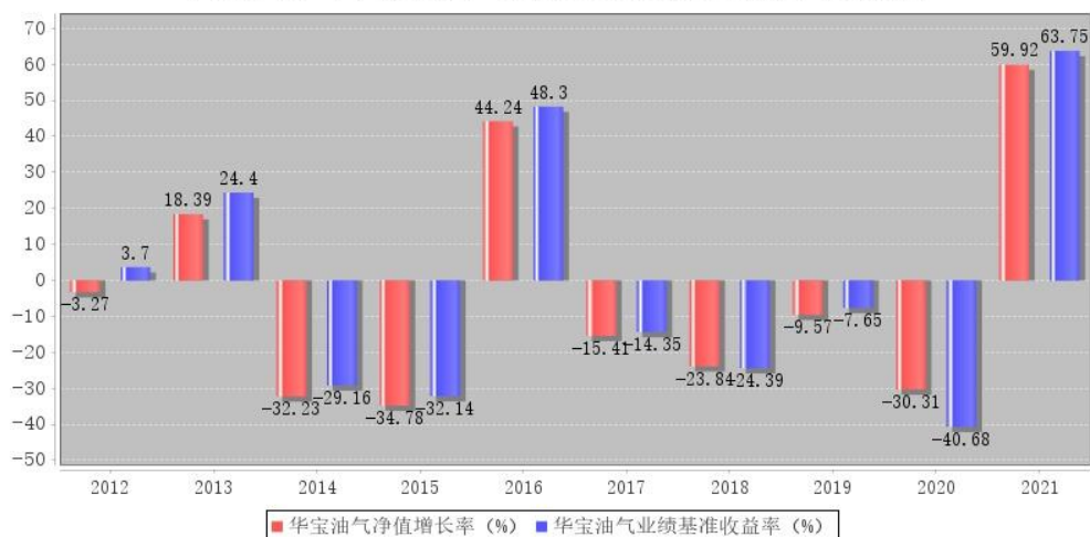
华宝油气每年净值增长率与同期业绩比较基准收益率的对比图